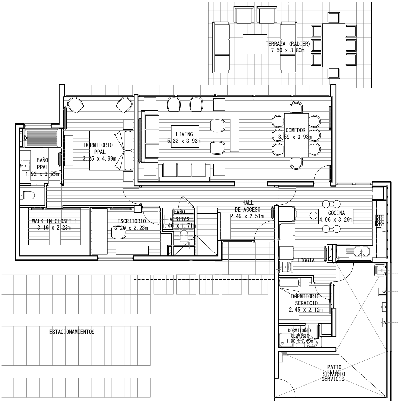
PLANTA PISO 1 PATIO SERVICIO LATERAL